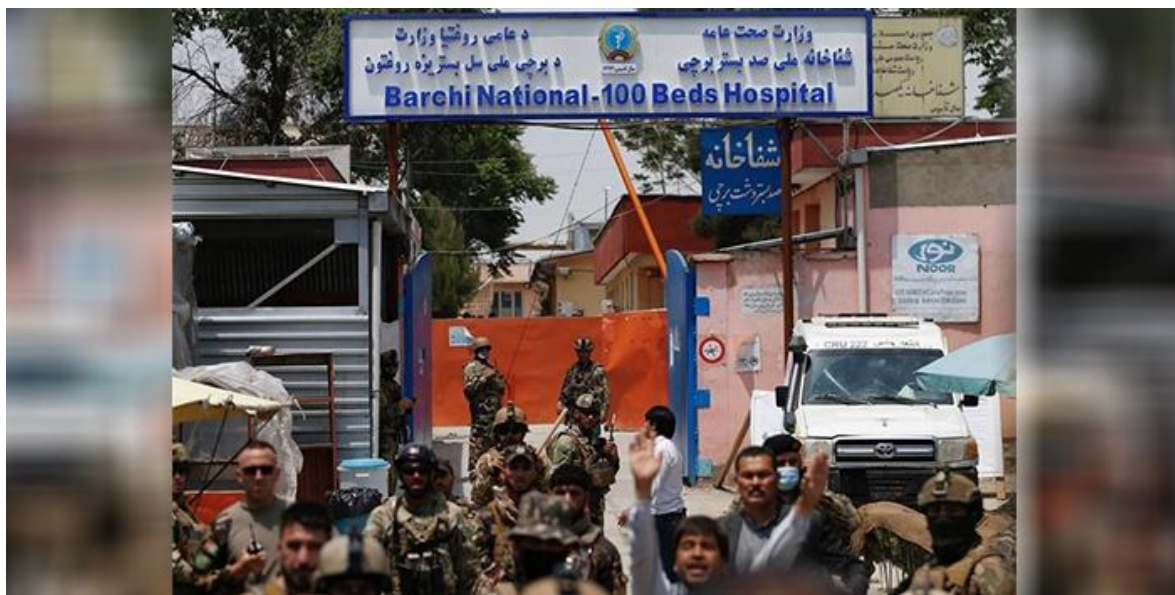
چندین نفر به‌شمول نوزادان و زنان در این حمله افراط‌گرایان مذهبی کشته شدند

در قدم دوم، کانال‌های افراطی خشونت‌گرا در شبکه‌های اجتماعی به گستره‌ی نفوذ ایدئولوژیک گروه‌های افراطی مانند طالبان که قبلاً در مناطق دوردست و روستایی نفوذ داشتند در یک سطح وسیع‌تر در افغانستان کمک می‌کنند. در قدم سوم، فعالیت این گروه‌ها در فضای مجازی، خصوصاً فعالیت‌های شبکه‌های سلفی خشونت‌گرا در شبکه‌های اجتماعی باعث تشدید روحیه فرقه‌گرایی و خلق دینامیک‌های جدید منازعه در افغانستان خواهد شد که این امر روی دورنمای صلح و ثبات کشور تأثیر منفی می‌گذارد.